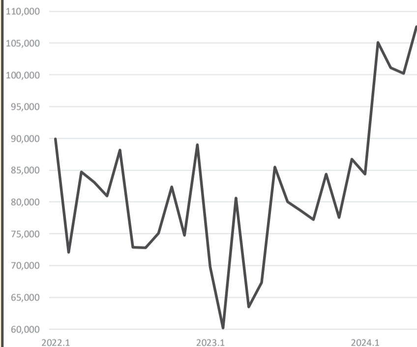
対外証券投資・株式投資ファンド(億円)

財務省「対外対内証券投資」によると、国内から海外への対外投資が2023年以降加速している。とくに、海外への証券や株式ファンドへの投資が、月による変動はあるものの、趨勢として増加を続けている。円安により日本の証券・株式への海外からの投資も拡大している一方で、新NESA等の政策も加わり海外への投資規模が拡大している。為替介入等により円高に大きく転換することは、こうした海外資産の損失拡大にも結び付く。